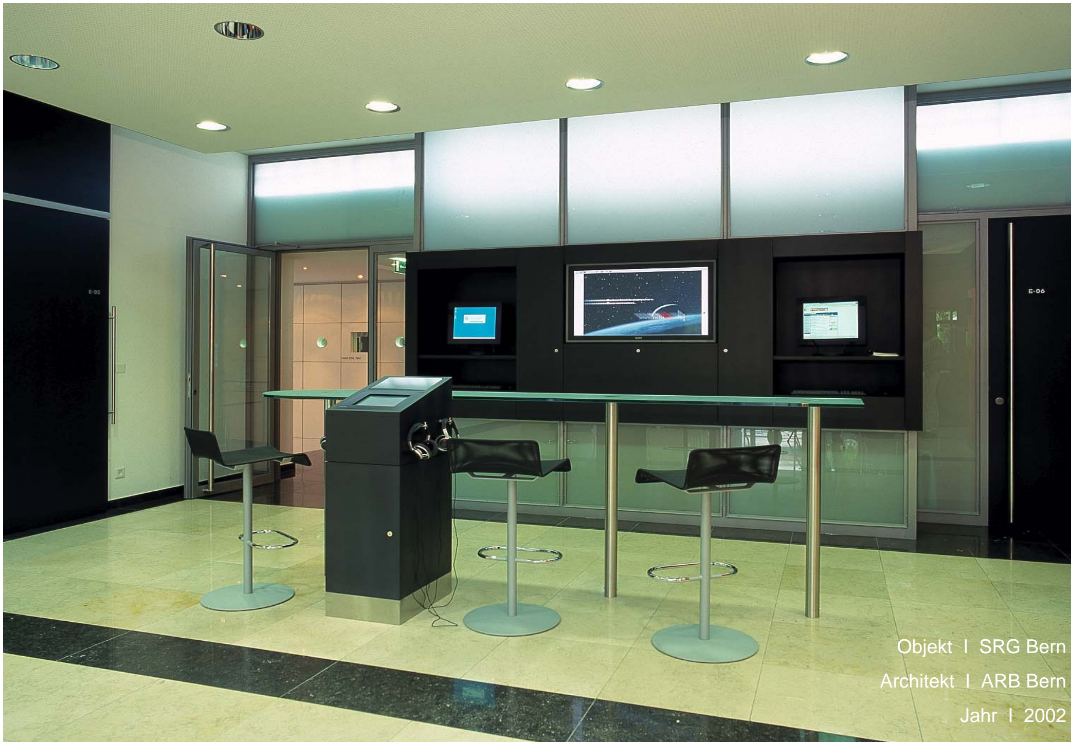
Objekt | SRG Bern Architekt | ARB Bern Jahr | 2002