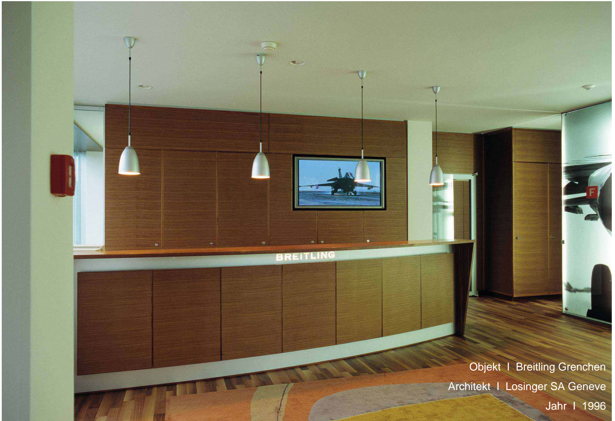
Objekt | Breitling Grenchen Architekt | Losinger SA Geneve Jahr | 1996